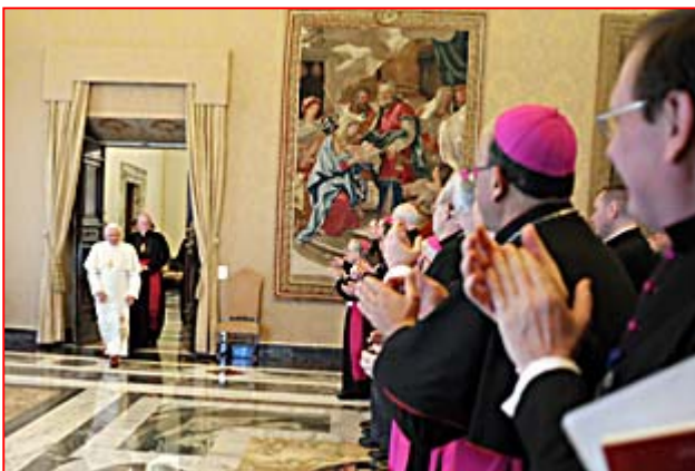
Città del Vaticano, Palazzo Apostolico sabato mattina 21 febbraio 2009 Udienza del Papa nella Sala del Concistoro concessa ai partecipanti alla plenaria della Pontificia Academia pro Vita